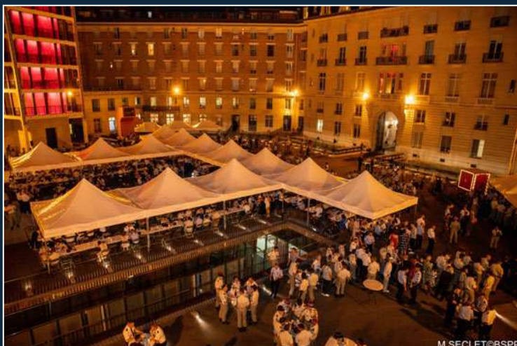
Buffet à l'état-major de la Brigade