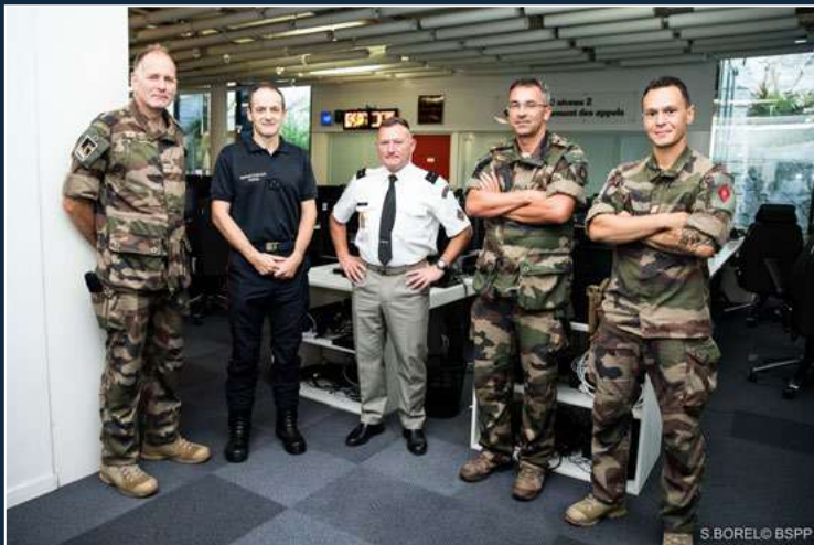
Visite du centre opérationnel