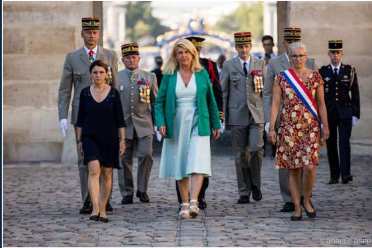
Arrivée des autorités