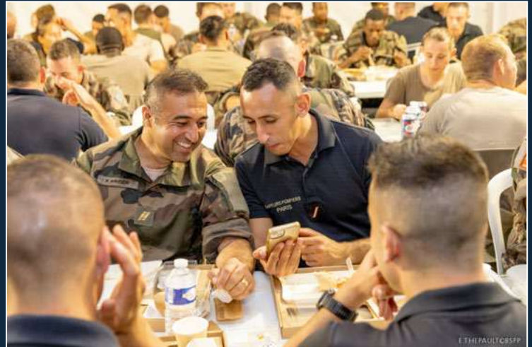
Moment de camaraderie