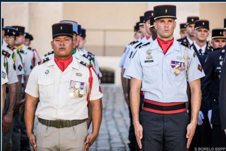
Cérémonie aux Invalides