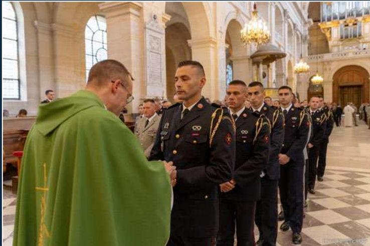
Messe aux Invalides

Les 6 et 7 septembre 2023 ont été marqués par le baptême conjoint des promotions de sous-officiers de la Brigade et de l'École nationale des sous-officiers d'active (ENSOA) de Saint-Maixent-l'École. Retour en images sur les moments forts de cet évènement historique, parmi lesquels une messe donnée en la cathédrale Saint-Louis des Invalides et la cérémonie de parrainage dans la cour d'honneur des Invalides, ainsi que de nombreux moments de partage, de cohésion et de fraternité.