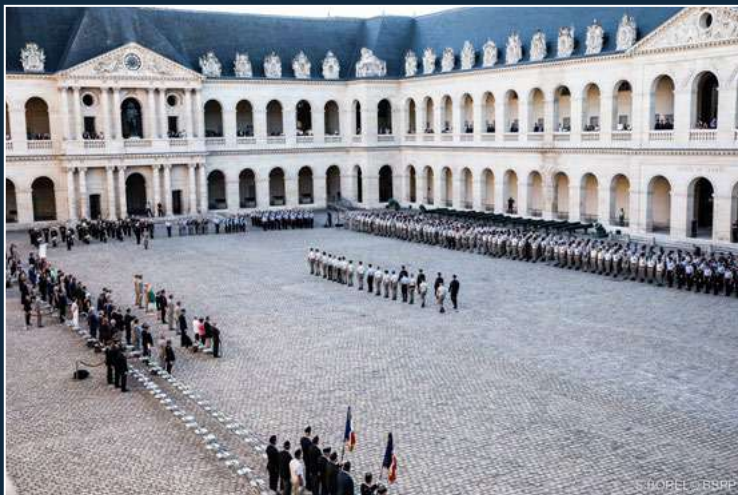
Cour d'honneur des Invalides