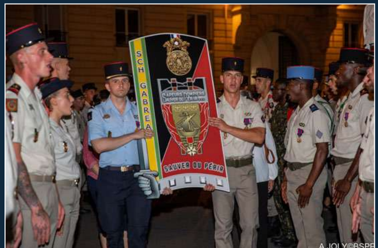
Remise du totem à la 5 e compagnie d'incendie et de secours