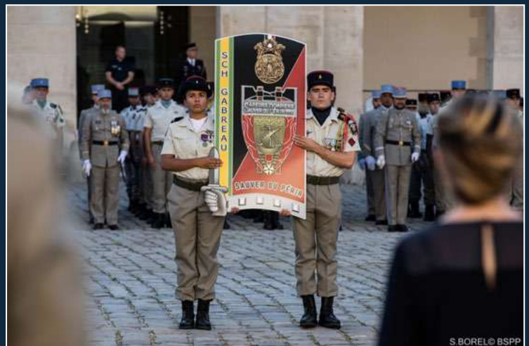
Insigne de la promotion