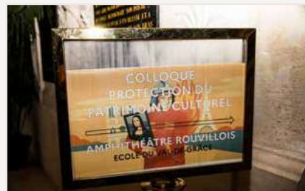
CAROL-CHES SYLVIA BOREL